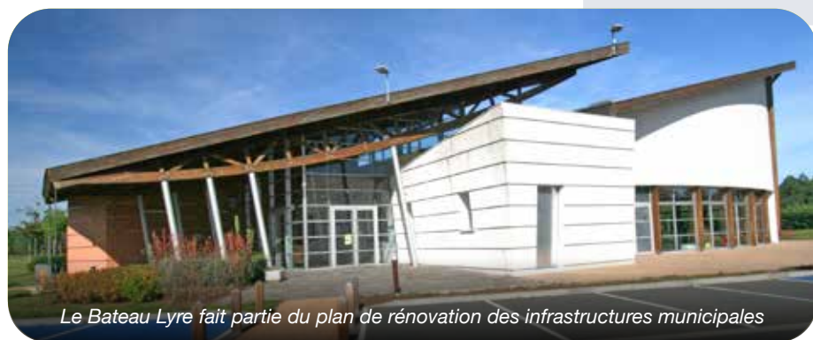
Le Bateau Lyre fait partie du plan de rénovation des infrastructures municipales

Concentrée sur la finalisation des projets initiés lors du précédent mandat (réalisation de la phase 2 de l'aménagement du centre-bourg, poursuite de l'installation de la vidéoprotection...), l'équipe municipale s'attelle également à la concrétisation de nouvelles initiatives, nécessaires pour accompagner l'évolution du Barp. La renaturation des cours d'école, la rénovation des infrastructures de sport et de loisirs, la mise en place de visites à domicile pour les aînés ou encore la création de nouveaux événements (guinguette estivale, Café de la Maire pour les jeunes, soirées des bénévoles...) figurent sur la feuille de route de ces prochaines années.