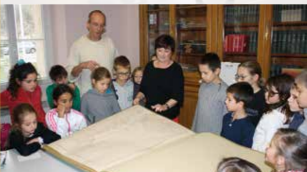
Visite de la mairie par l'école