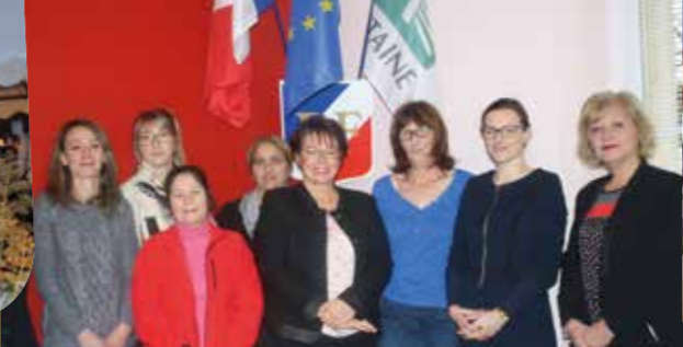
Equipe du Saad (Service d'Aide à Domicile)