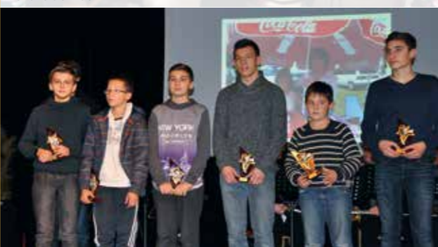
Cérémonie des vœux