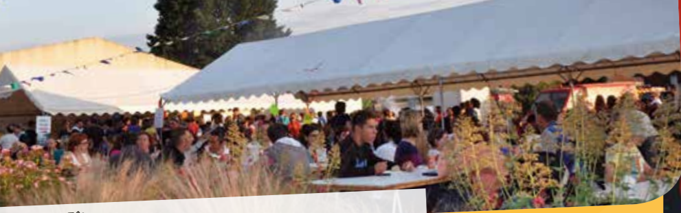
Eyre de Fête